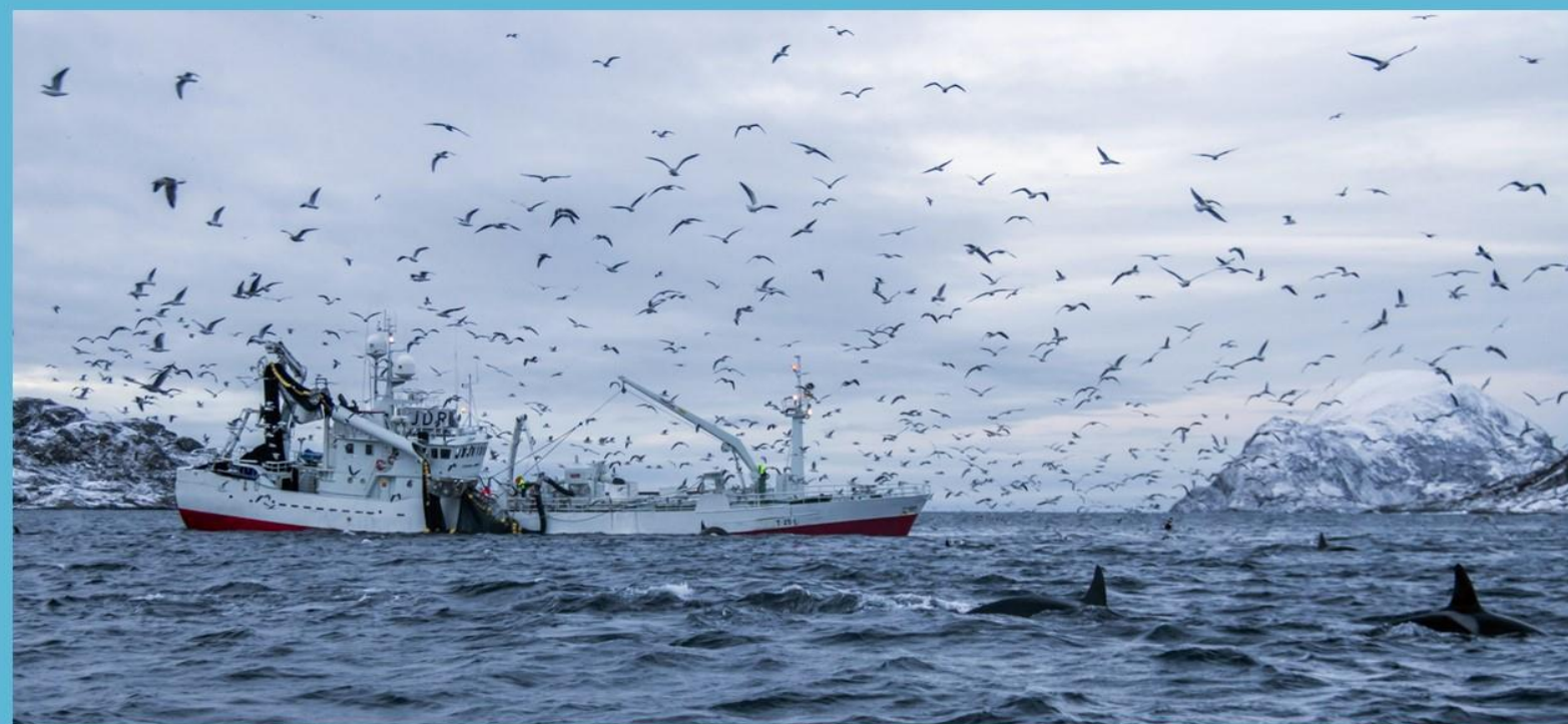
Frantsen Junior, nå Slottstein.

Fiskeritillatelsene skulle deles i kvotefaktorer som anga fartøyets andel av