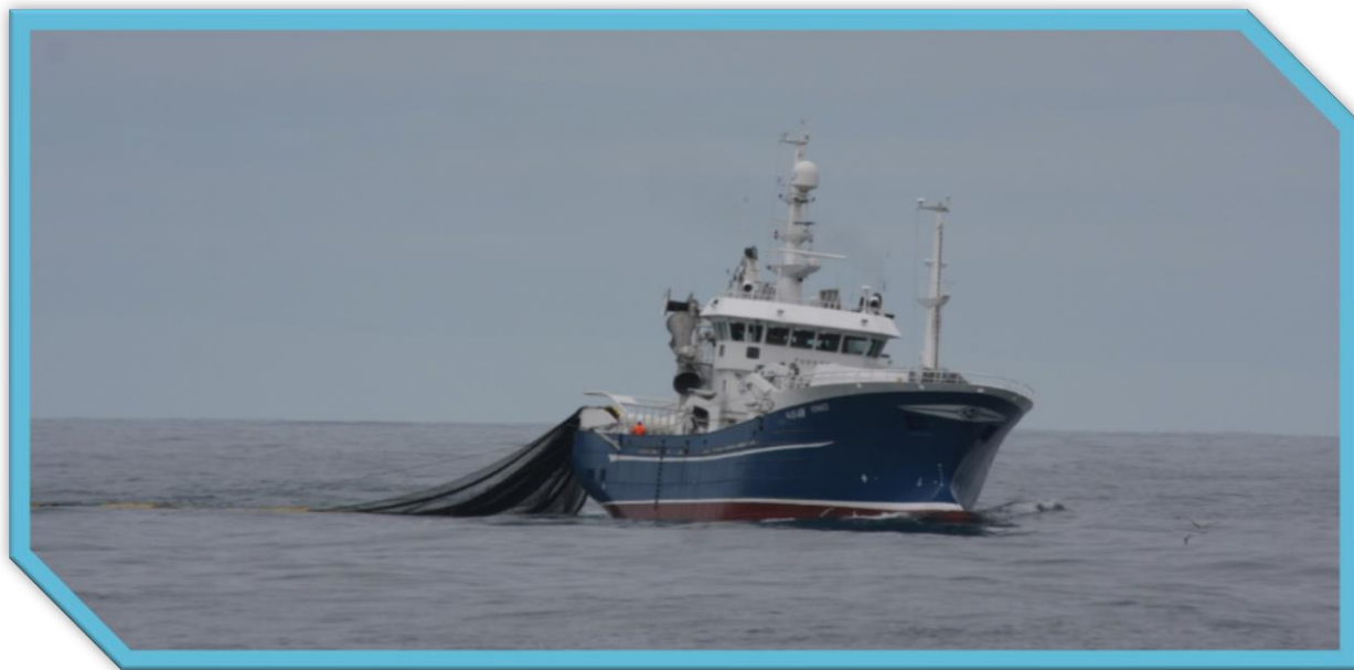
Fønnes med nordsjøsildekast.

Forslaga er ikkje konsekvensutgreidd, og forslaga vil ha store negative konsekvensar for flåten, landindustrien og distrikta.