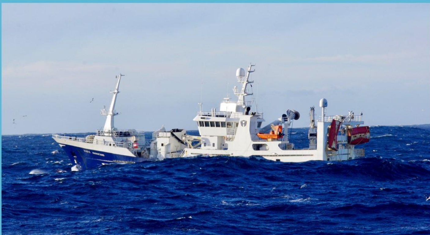
Krossfjord på loddeeleiting.

Fiskarane, og ikkje minst kjøparane, viste nok ein gang stor evne til å ta utfordringar på strak arm. Det viste seg at pelagisk sektor