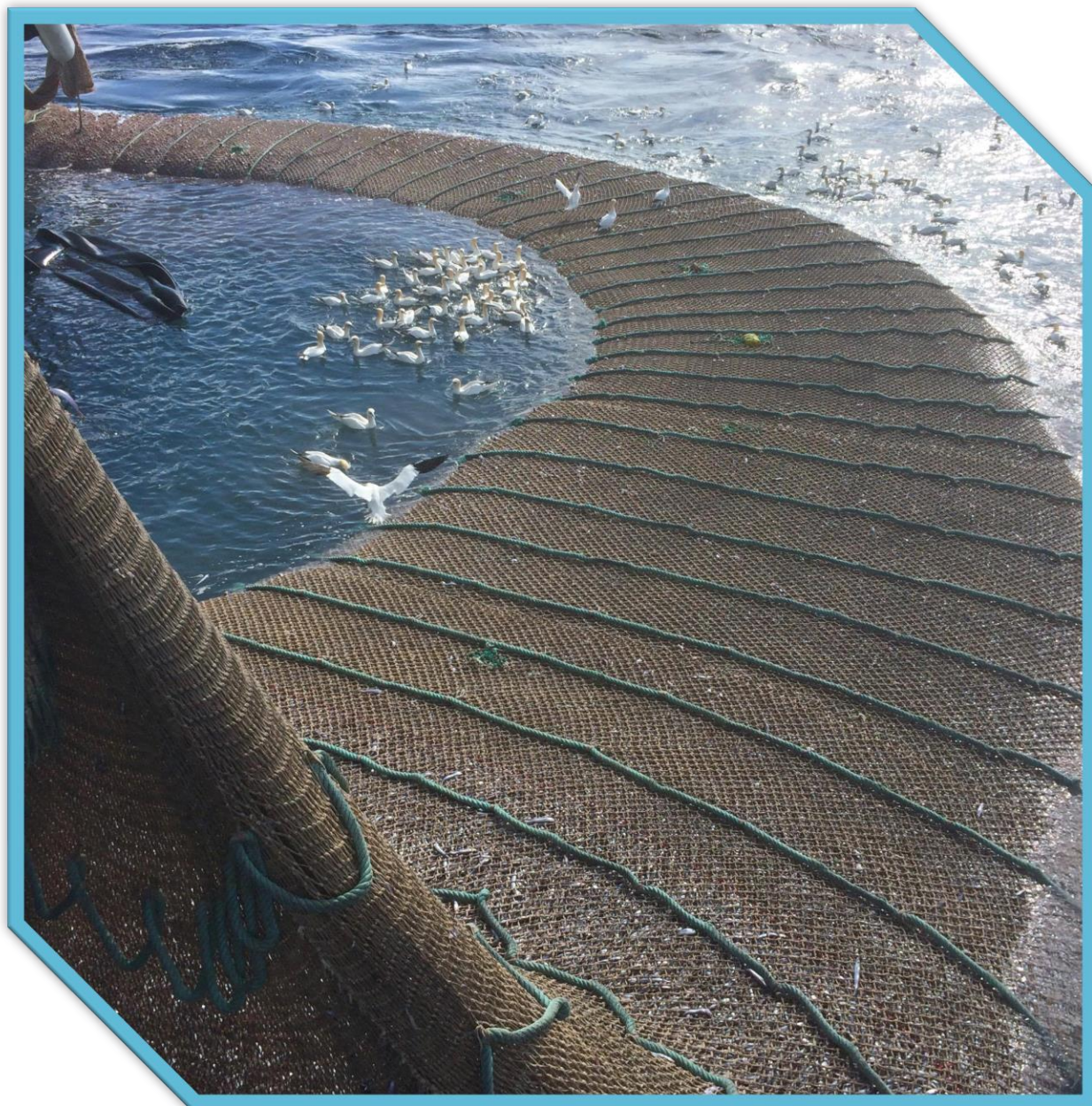
Vea med tobishal.

totalkvoten. Hjemmelslengde skulle erstattes av faktisk lengde i kyst. Gruppeinndeling skulle ligge fast, men ringnot og pelagisk trål skulle slås sammen. Spesialordningene som de ble kalt, samfiske og slumpfiske, skulle erstattes av kvoteutleie. Strukturkvotene som gikk ut på dato var det litt ulike meninger om. Det som fikk mest oppmerksomhet var forslaget om statens felles kvotebeholdning som skulle kunne