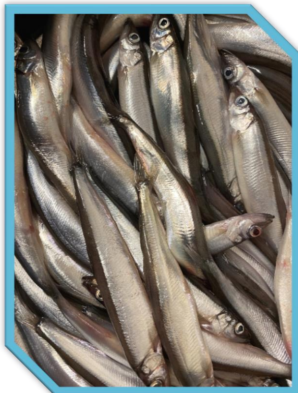
Lodde på Værøy.

Då det kom ei ny høyring, om fordeling av strukturvinstar, haldt styret fast på at desse skal gå tilbake til grunnkvotane. Styret uttrykte òg at absolutte kvotetak ikkje må endrast.