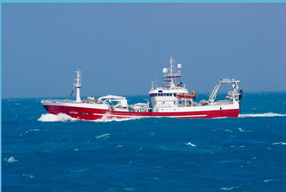
Vestviking, nå Harald Johan.